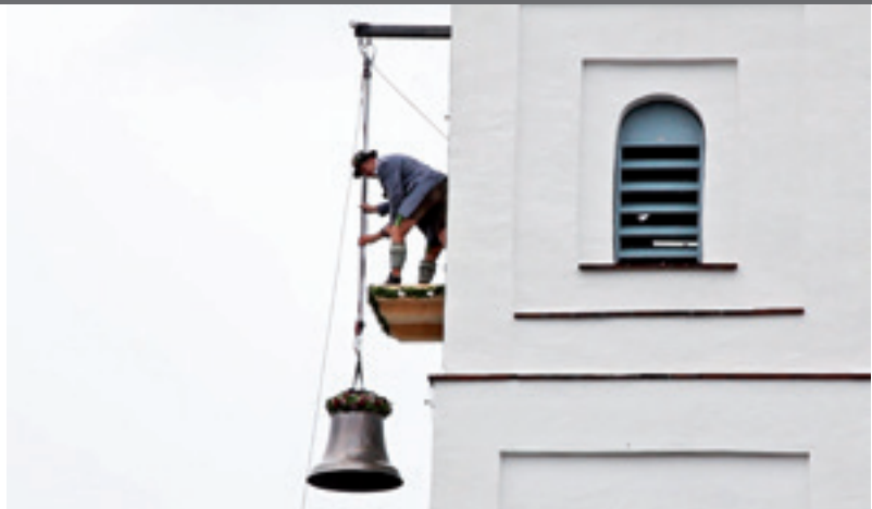
Eine der beiden Glocken kurz vor dem Ziel

Ein paar bange Minuten diskutierten die Verantwortlichen, ob unter diesen Bedingungen die Glockenweihe und das anschließende Aufziehen der Glocken überhaupt stattfinden können. Doch schlussendlich setzten sich die Befürworter durch und verzichteten konsequenterweise auch nicht auf jene Programmteile, die unter freiem Himmel stattfanden. Nach einem kleinen Imbiss im Feuerwehrhaus versammelte Weihbischof Florian Würner alle Bürger zur Statio in der Dorfkirche St. Johannes Baptist. Anschließend weihte er die beiden neuen Glocken, die die Passauer Gießerei Perner gegossen hatte. Nach einem Umzug durch das Dorf auf dem festlich geschmückten Leiterwagen, zogen die Hofheimer Ministranten schließlich bei strömendem Regen die Glocken hinauf in etwa 20 Meter Höhe. Begleitet von abwechselnden Gesängen der Geistlichen und der Gemeinde. Ein würdiger Höhepunkt eines festlichen Tages. Den Schlusspunkt setzte die erste öffentliche Aufführung des „Glocken-Boarischen“. Ein Musikstück das der gebürtige Hofheimer Musiker Josef Felix zum 1250-jährigen Jubiläum Hofheims und zur Glockenweihe eigens komponiert hat.