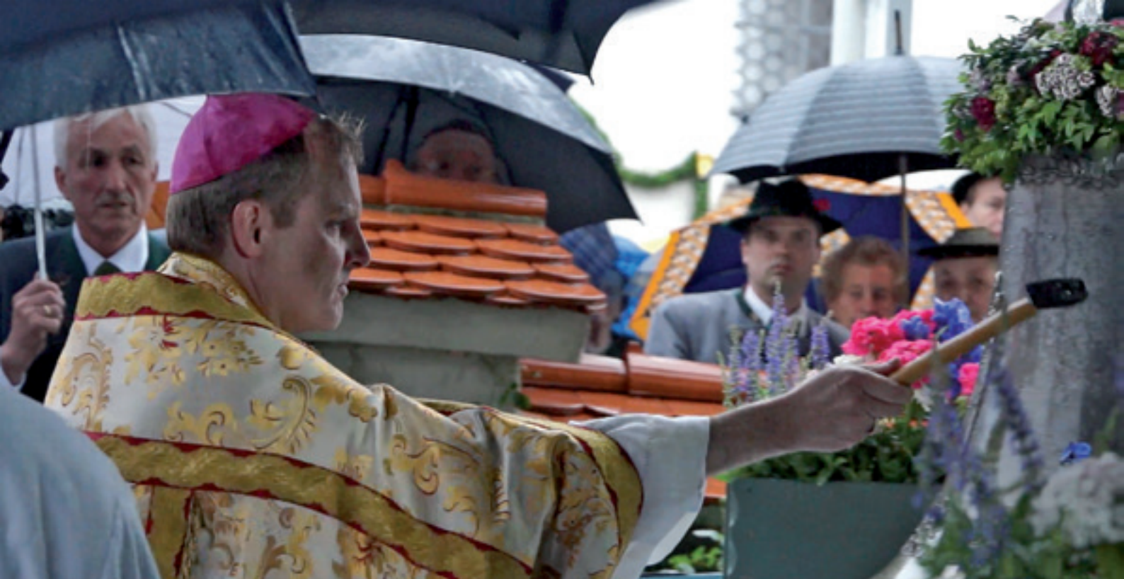
Weihbischof Florian Würner beim ersten Anschlagen der neuen Glocken