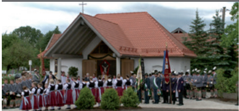
Einweihung des neuen Leichenhauses